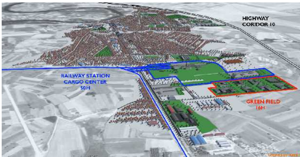
Индустријска зона Минел