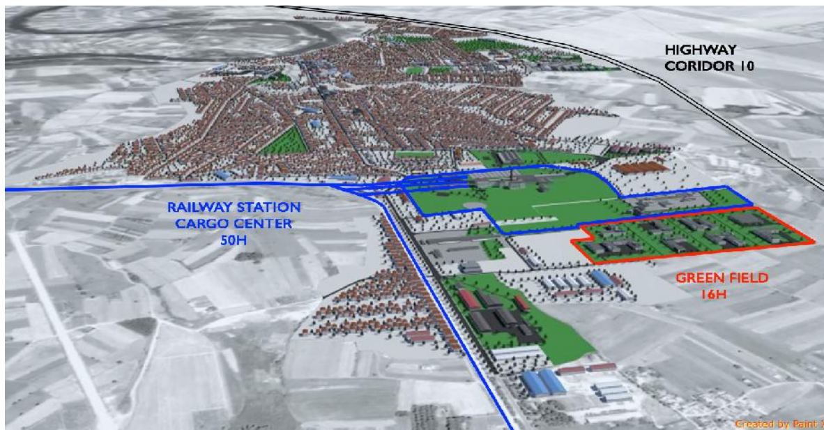
Индустријска зона Минел