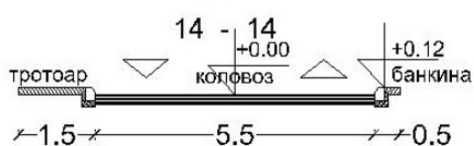
КООРДИНАТЕ ОСОВИНА САОБРАЋАЈНИЦА