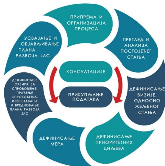
Фазе израде Плана развоја

Процес израде Плана развоја у општини Ћуприја спроведен је кроз законом прописане главне фазе које су илустроване на следећој слици.